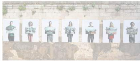
3. Martın Bienali