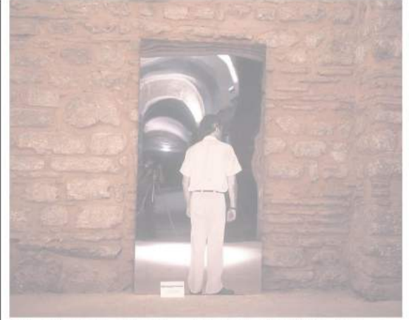
Michelangelo Pistoletto, "Adanın Sırtı". 1. Uluslararası İstanbul Çağdaş Sanat Sergisi, 1987.

İstatistiklere bakıldığında, bugüne kadar SAHA'dan bir sanatçının 10'dan fazla; beş sanatçı / küratörün beşten fazla ve 15 sanatçının üçten fazla eser üretimi, sergi ya da eğitim katılım desteği aldığı görülüyor. Desteğin yalnızca büyük etkinliklere verildiği eleştirisiyle ilgili olarak SAHA, derneğin uluslararası bilinirliği arttıkça